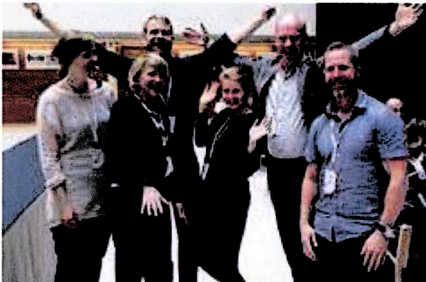
Delegasjon fra Sunne kommuner på WHO's Healthy Cities-konferanse i Kuopio!