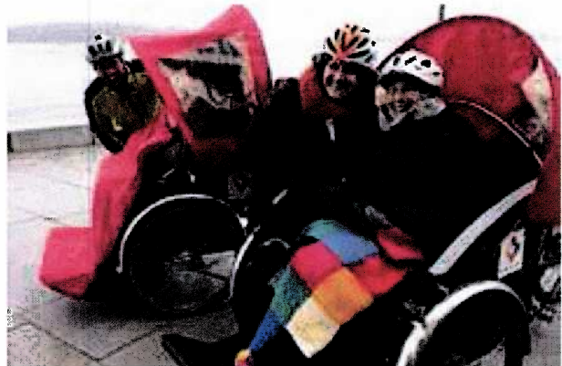
Vi har inngått samarbeid med Sammen På Sykkell!

Det er gitt innspill til ny folkehelsemelding (Meld St. 19 (2014-2015) Mestring og muligheter), og oversendt høringsnotat til stortingshøringen om samme melding. Nettsiden har gjennomgått forandringer og det er blant annet en egen ressursbank med sentrale nettsider og dokumenter som kan være nyttige i folkehelsearbeidet. Temagruppene har fått sitt eget område på nettet, og det skrives kontinuerlig nettsaker om medlemmenes gode folkehelsearbeid. I oktober 2015 hadde vi også et folkehelsebilag i Dagens Næringsliv i samarbeid med Folkehelseforeningen. Sekretariatet har vært involvert i HelseDirektoratets nye kommunikasjonssatsing på folkehelsefeltet. Kommunikasjon er et satsingsområde som er svært viktig for å synliggjøre nettverket som troverdig, vitalt, nyttig og toneangivende på folkehelsefeltet, og vi ser gode resultater av denne satsingen.