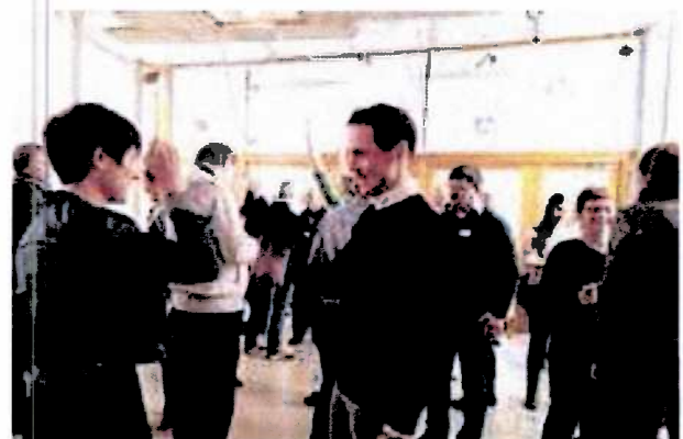
Kreativ prosess på Lillehammer